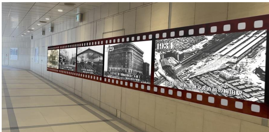
「大阪梅田駅 AR 写真展」(イメージ)

大阪梅田ツインタワーズ・ノース2階東西通路では、阪急大阪梅田駅の歴史がAR写真でよみがえります