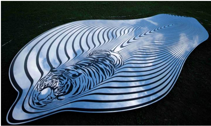
※縦10m x 横7mのステンレスミラー