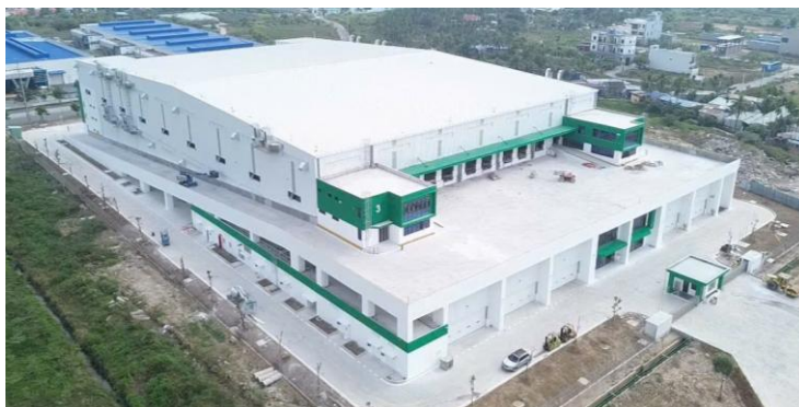
セムコープ ロジスティクスパーク（トゥイグエン）外観