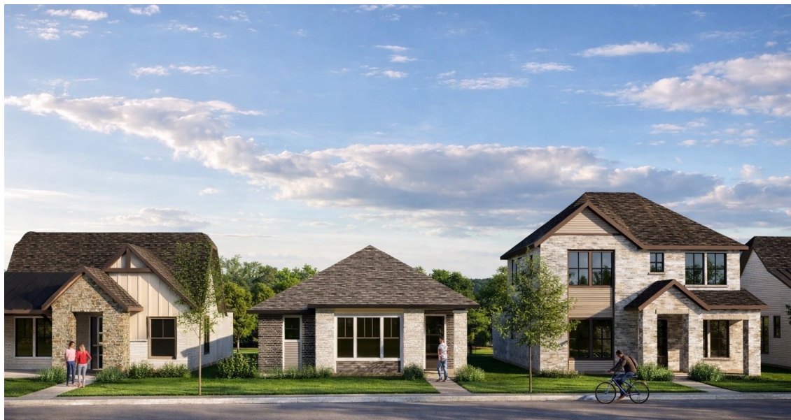
分譲戸建住宅（イメージパース）

阪急阪神不動産株式会社は、アメリカの不動産デベロッパー「Bridge Tower Homes」と協働し、テキサス州のダラス・フォートワース都市圏※における総戸数2,700戸超の大規模タウンシップ開発『(仮称)Meraki』の一部区画に参画することになりましたので、お知らせいたします。本タウンシップ開発の中では、複数のデベロッパーが戸建住宅分譲事業を手掛けており、当社は同開発において総戸数31戸の戸建住宅分譲事業（以下、本プロジェクト）に参画し、本年秋からの順次竣工を目指してまいります。なお、本プロジェクトは、当社のアメリカにおける戸建住宅分譲事業の第2号案件となります。