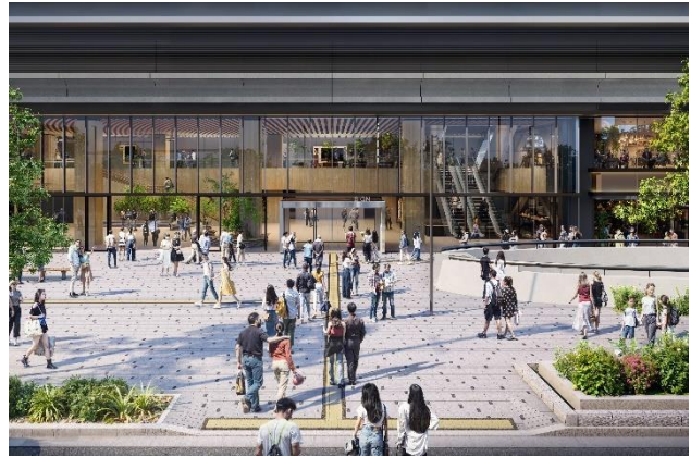
左：(仮称) 市民利用空間、右：正面エントランス前空間（イメージ）