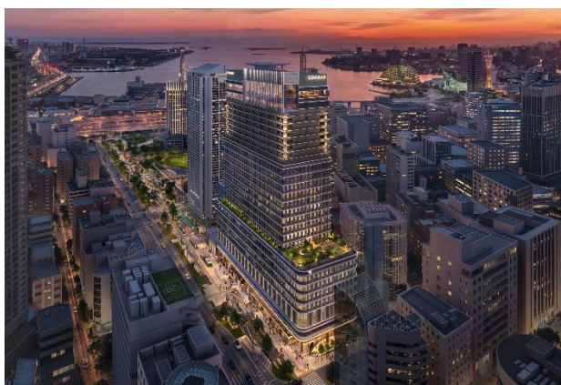
夜間時の外観（イメージ）

神戸の海と山を結び、周辺の景観と調和する神戸らしい上質な外観をイメージし、ホテルなどが入る高層部はガラスボックスを頂部に取り入れた特徴的なデザイン、市役所機能などが入る低層部は旧2号館から継承した水平基調を意図したデザインとしています。夜は天井の高いホテルロビー空間がライトアップされ、まちの灯台のように遠くからも港町神戸を感じられるランドマークとなります。