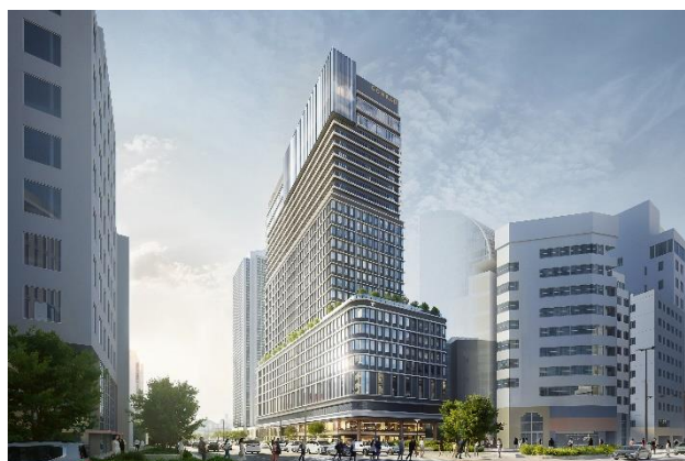
外観イメージパース※2

オリックス不動産株式会社（本社：東京都港区、社長：北村 達也）を代表企業として、阪急阪神不動産株式会社、関電不動産開発株式会社、大和ハウス工業株式会社、芙蓉総合リース株式会社、株式会社竹中工務店、安田不動産株式会社から構成されるコンソーシアム（以下、「本コンソーシアム」）は、このたび、「神戸市役所本庁舎2号館再整備事業」※1において、建設工事に本格着手しますのでお知らせします。