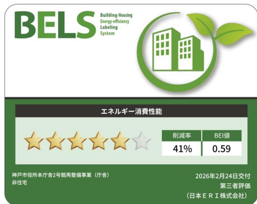
市庁舎部分：BELS 認証 ZEB-Oriented 相当

防災面では、中間階免震構造を採用することで地震時の安全性向上を図るとともに、浸水対策として電気室や機械室、防災センターなどの重要設備室を上層部に配置するなど、災害時のリスク低減を図ります。あわせて、民間エリアの一部を一時滞在施設として開放することを想定するなど、帰宅困難時対策の役割も担います。