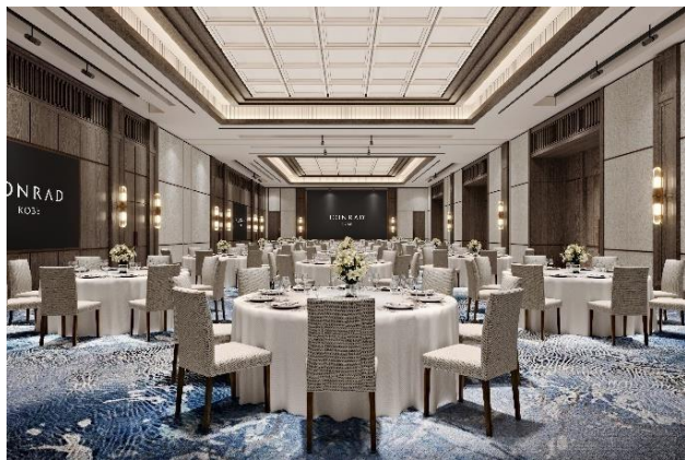
左：レセプションロビー、右：ボールルーム（イメージ）