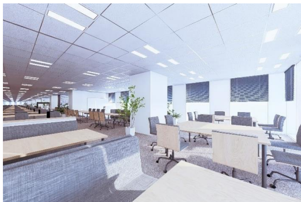
オープンな執務空間（イメージ）

コミュニケーションの活性化や時代の変化への柔軟な対応のため、間仕切りのないオープンな執務空間を確保するとともに、遮音性の高い会議室や上下階の交流を円滑にする内部階段の設置などにより、職員が働きやすく、生産性の高いオフィス環境を整備します。また、環境性能として、市庁舎部分において「ZEB Oriented」相当を達成し、BELS 認証（建物の省エネルギー性能を表示する第三者認証制度）を取得しています。