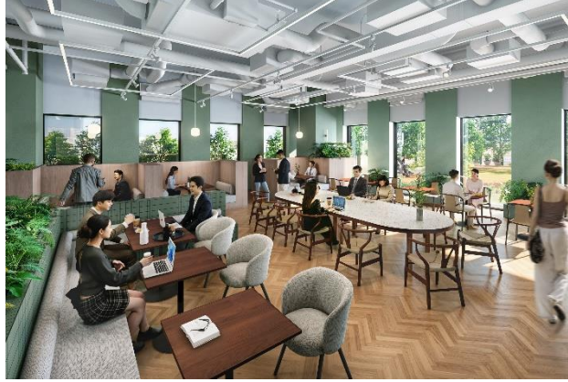
9階オフィスワーカー専用ラウンジ（イメージ）

神戸市内で最大級の1フロアあたりの貸付面積が約500坪（約1,680㎡）となるハイグレードなオフィスを整備します。1フロアの一体利用から最小約45坪（約150㎡）の分割利用まで、企業の進出ニーズに応じてフレキシブルにご利用いただけます。また、9階の屋上庭園に面して、気分転換やサードプレイスなどさまざまなシーンで利用できるオフィスワーカー専用ラウンジを整備し、オフィスワーカーのサポートと企業間交流の促進を図ります。