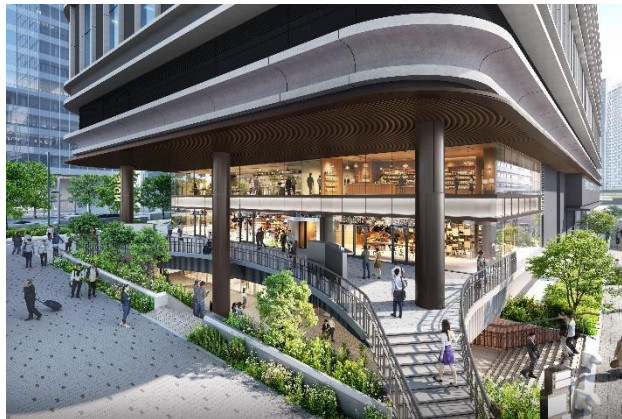
サンクンガーデンに面した商業施設（イメージ）

フラワーロード沿道に面した地上1・2階、さんちかや地下鉄海岸線三宮・花時計前駅とつながる地下1階を含む3フロアに、地域の魅力を発信するなど個性あるさまざまな飲食・物販・サービス店舗を配置するとともに、地上と地下をつなげる開放的なサンクンガーデンを整備することで、神戸のまちの回遊促進および賑わい創出を図ります。