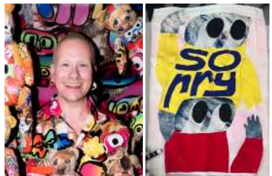
バス・コスターズ氏

オランダ・アムステルダムを拠点に活動するアーティスト／デザイナー。ファッションデザイナーとして注目を集めた後、テキスタイルを軸に、ドローイング、立体、陶芸へと表現を拡張。オランダのトゥウェンテ国立美術館で大規模回顧展を開催し、ヨーロッパを中心に、美術館、ギャラリー、アートフェアで活動中。