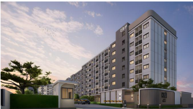
『コージー ラプラオ 107』外観（イメージ）