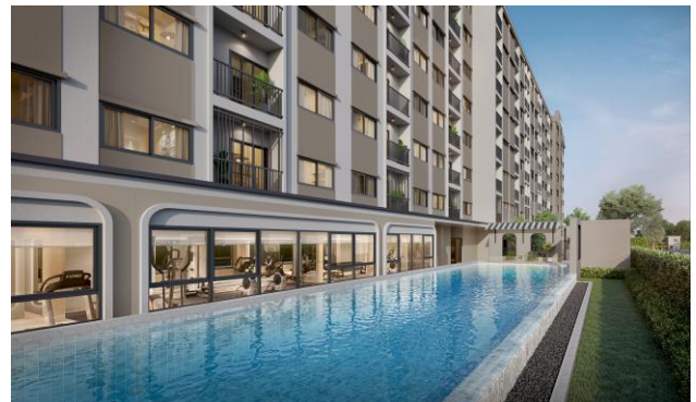
共用施設のプールとジム（イメージ）