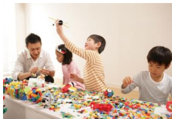
【LaQハカセがやってくる】