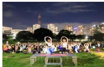
【YOGA祭 2024 in Nishinomiya】

https://www.bodies.jp/yoga-festival/2024nishinomiya