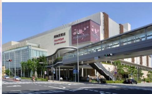
阪急西宮ガーデンズ 外観

本リニューアルでは、西日本初出店の子ども靴「IFME(イフミー)」やラーメン「鯛塩そば灯花」のほか、関西初、新業態の店舗などを含む28店舗が新規オープン、17店舗が改装・移転します。アウトドアブランドの拡充や、インテリアショップ、ファッションブランドなども新たに加わり、上質なライフスタイルを提案するショッピングモールとして、より一層多様なニーズに応えます。