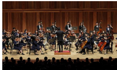
【スーパーキッズオーケストラ ミニコンサート】