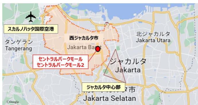
ジャカルタ近郊 位置図（黄色のラインは高速道路）