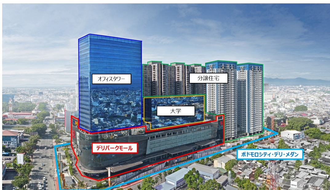
大規模複合開発施設『ポドモロシティ・デリ・メダン』および 「デリパークモール」の外観