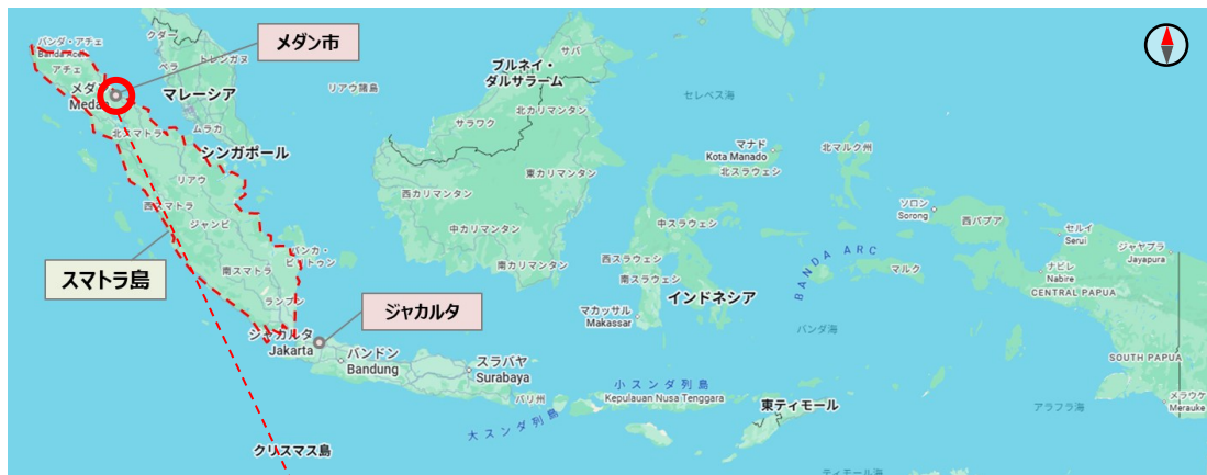
インドネシア全体