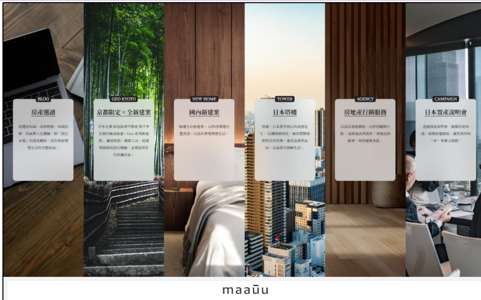
maaū (也有房産)社が提供しているホームページの画面

阪急阪神不動産株式会社は、台湾の不動産テックベンチャーの細細生活網路科技股份有限公司（本社：中華民国台北市、以下、「maaū (也有房産)社」と、業務提携契約を締結しましたので、お知らせします。この提携により、maaū (也有房産)社が提供する不動産販売プラットフォームを通じて、台湾のお客様に、当社が日本で取り扱う住宅の売買仲介サービスの提供を行ってまいります。