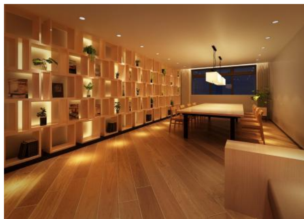
ジオ明石本町 ブックラウンジ（パース）

当社では、これまでも「ジオ西宮北口ザ・ソフィア（2018年竣工）」のエントランスに六甲山の間伐材を使用しているほか、「ジオ明石本町」では、共用部のブックラウンジの壁面の棚・ビッグテーブル・椅子・ソファ等に兵庫県産の木材を採用しています。また、「ジオ江坂垂水町」、「ジオ甲子園口 二見町」等でも、共用部の壁面や家具、外部の軒裏天井等に国産木材を採用する予定です。