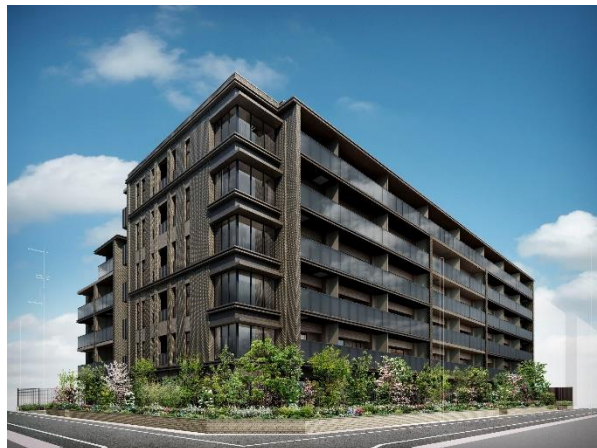
ジオ甲子園口 二見町 外観予想図（パース）

美しい生活文化と落ち着いた街並みが息づく成熟の邸宅街、甲子園口「二見町」に揺るぎない美邸を創出すべく計画を進めてまいりました。