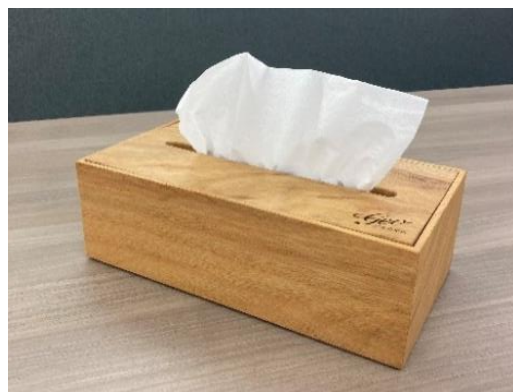
ご入居者さまプレゼントのティッシュボックス (神戸市の街路樹の手入れの際に発生したクスノキの伐採木で製作)

※1 地表植物が豊富になることで、雨水がそれらの葉で受け止められるとともに、増えた植物の根によって土壌がスポンジ状になり、雨水が一気に流れ出ず、森林土壌の中で保水されるという水源かん養機能の高まりが期待できます。