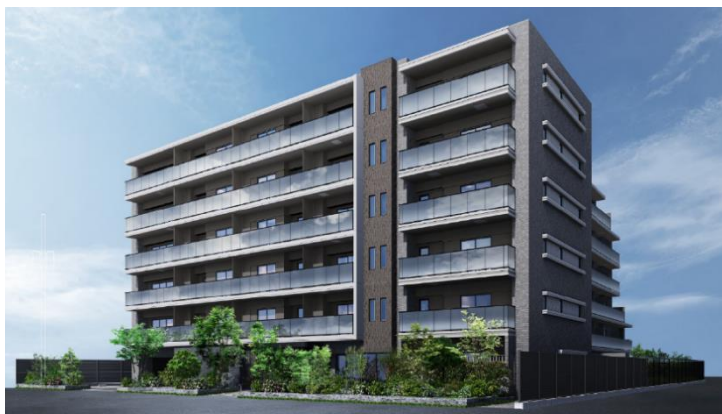
「ジオ江坂垂水町」 外観予想図（パース）

「江坂」駅を利用すれば、新大阪や梅田、本町、難波、各都心へダイレクトアクセスが可能なほか、駅周辺には生活利便施設が充実しており、ご入居者さまの生活をサポートしてくれます。〈ジオ〉の分譲マンションシリーズの中で江坂駅を最寄りとした物件は初となり、にぎわいのある江坂の地に〈ジオ〉が新たな価値を創出するべく計画を進めてまいりました。