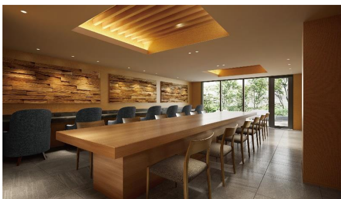
ジオ江坂垂水町 オーナーズラウンジ（パース）

国産木材を積極的に活用することで、森林が持つ水源かん養機能 ※1 の向上や二酸化炭素吸収機能 ※2 の向上、生物多様性の保全 ※3 の効果が期待できます。また、共用部の化粧材に使用する木材について、原則として、地産地消とすることで、地域の森林環境保全に寄与してまいります。