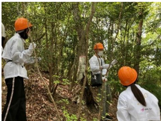
森林ボランティア体験研修

森林資源を適切に活用することは、森林の整備・保全につながり、自然災害の防止、二酸化炭素排出量の削減など、持続可能な循環に寄与します。