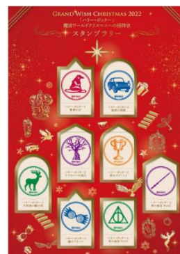
▲スタンプラリー台紙イメージ