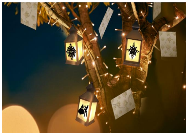
▲「ハリー・ポッター」モチーフの特別装飾イメージ

JR 大阪駅前に広がる約 1ha におよぶ「うめきた広場」の周辺やけやき並木、北館西側歩道の樹木 94 本にシャンパンゴールド色の LED 約 33 万球が上品に光り輝きます。