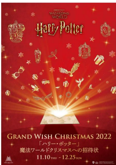
イベントメインビジュアル