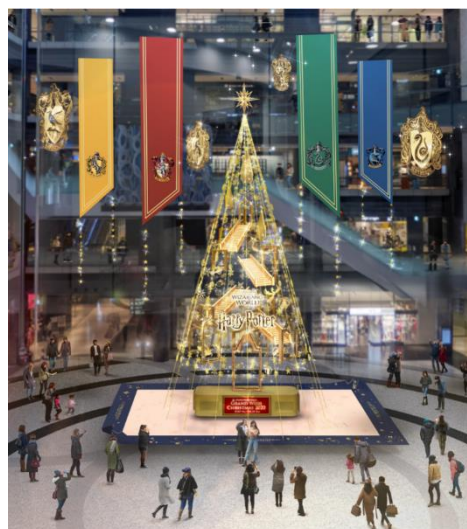
メインクリスマスツリー 『Floating Magic Tree 浮遊する魔法の樹』