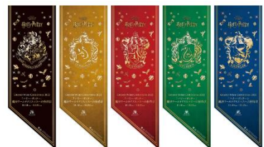
各所に「ハリー・ポッター」魔法ワールドモチーフの装飾が登場！

※新型コロナウイルス感染拡大の状況等により、本イベント内容は一部変更、または中止となる可能性がございます。