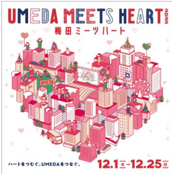
▲メインビジュアル

UMEDA MEETS HEART実行委員会（※1）は、梅田地区の冬の風物詩となることを目指し、“ハート”をモチーフに梅田のまちの魅力を発信するエリアイベント、「UMEDA MEETS HEART 2022」を開催します。