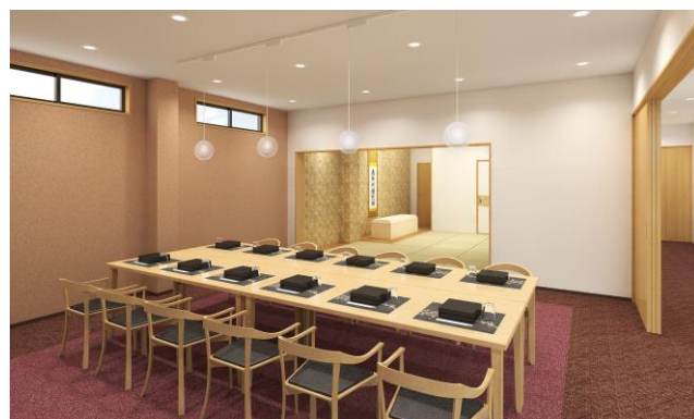
エテルノ鳴尾武庫川 会食室イメージ