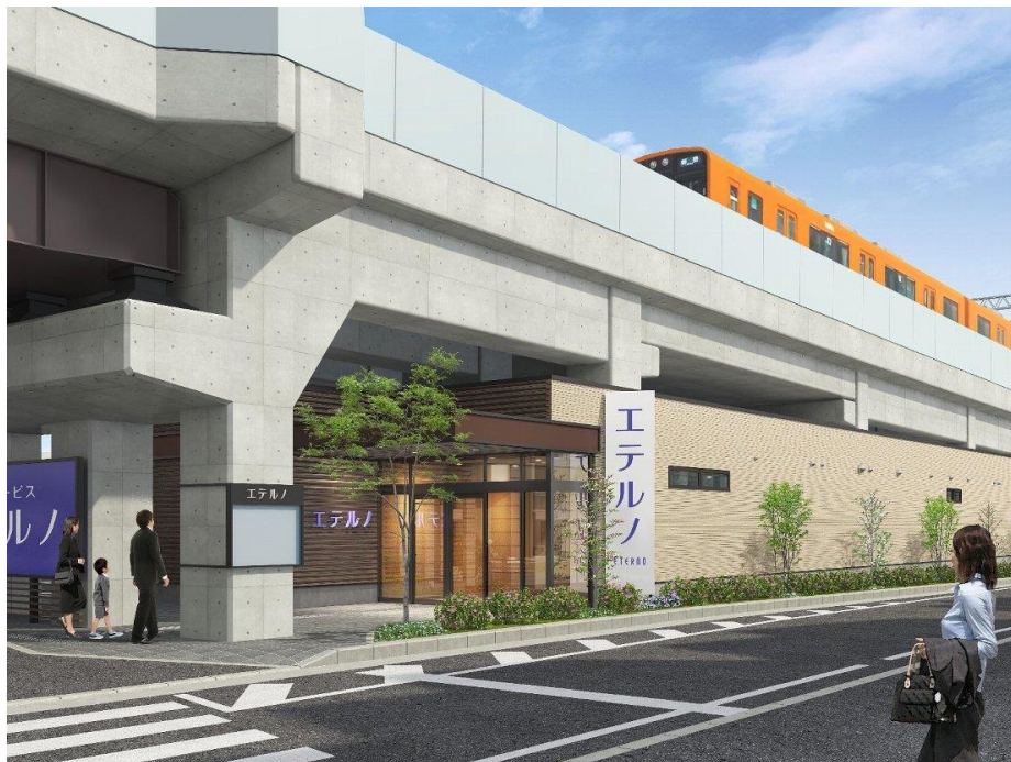
エテルノ鳴尾武庫川 外観イメージ