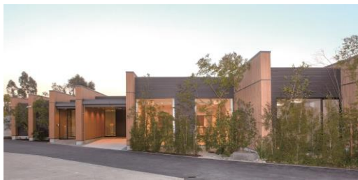
エテルノ阪急千里