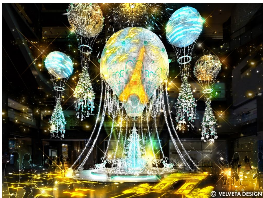
ライティングショー実施イメージ

大陸を巡り旅する気球たちは希望の光を運び、世界中の空をひとつに繋いでいく。この冬、願いを届ける幻想的なクリスマスツリー『Winter Voyage Tree』がナレッジプラザに登場します。それぞれの気球に彩られたオーナメントは、一つ一つ個性あふれる世界各地の建造物や植物、動物たちをモチーフに表現し、期間中は世界各国を旅するイメージを光で表現した「ライティングショー」も開催します。