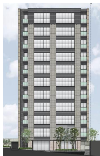
建替え後の完成予想立面図