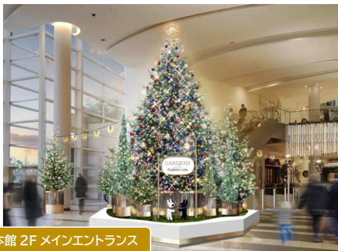
本館 2F メインエントランス