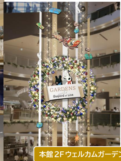
本館 2F ウェルカムガーデン