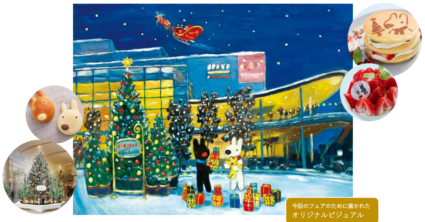
今回のフェアのために描かれた オリジナルビジュアル

リサとガスパールがやってきた様子を表現した高さ約7mのツリーが本館2Fメインエントランスに登場し、館内各所にはフォトスポットも設置いたします。さらに、一部店舗では、期間限定のオリジナルコラボメニューを販売し、オリジナルデザインのクリアファイルがもらえるスタンプラリーなど、ファンの方はもちろんたくさんのお客様にお楽しみいただける特別なクリスマスを開催します。