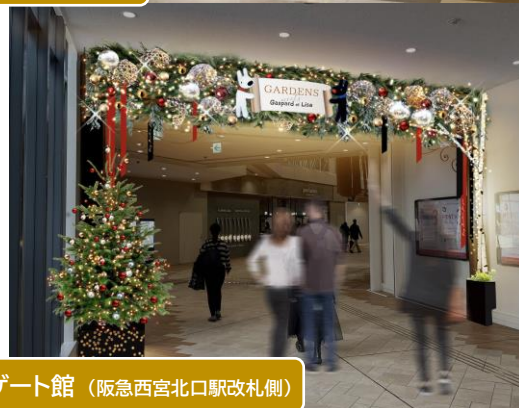
ゲート館（阪急西宮北口駅改札側）