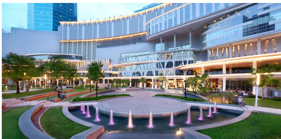
セントラルパークモールと中庭