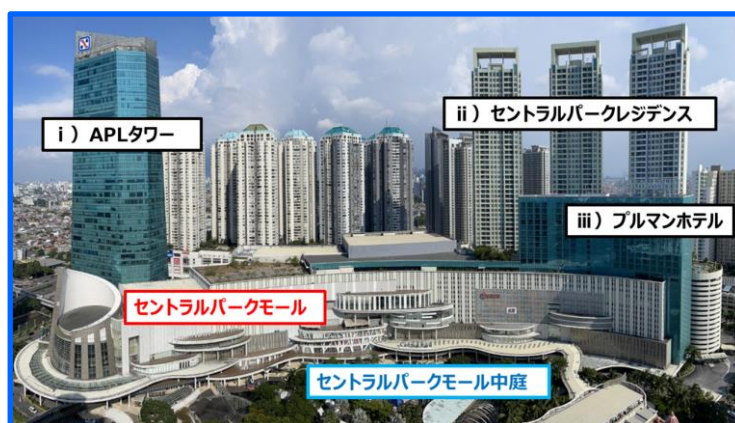
セントラルパーク複合施設