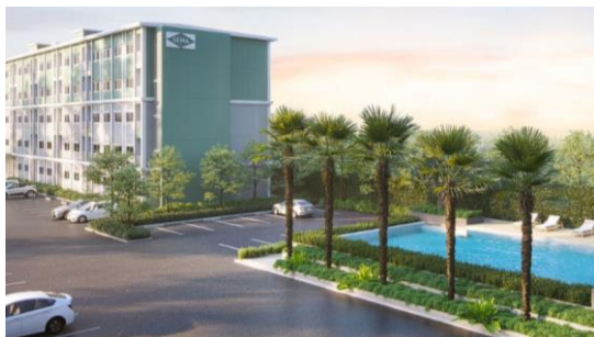
『SENA KITH Westgate Bang Bua Thong (セナ キス ウェストゲート バンプアトン)』