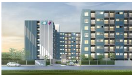
『(仮称)Bangkadi(バンカディ)プロジェクト』