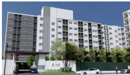
『SENA KITH Srinakarin Sridan (セナ キス シーナカリン スリダン)』