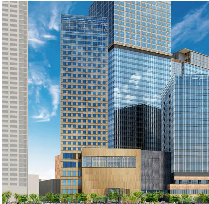
US ホテル「外観」(完成予想イメージ) ※今後変更となる可能性があります

US ホテルは、南街区賃貸棟・東棟の5階～28階に位置します。客室は23平米を中心とする482室で、レストラン、バー、フィットネスを設置予定です。