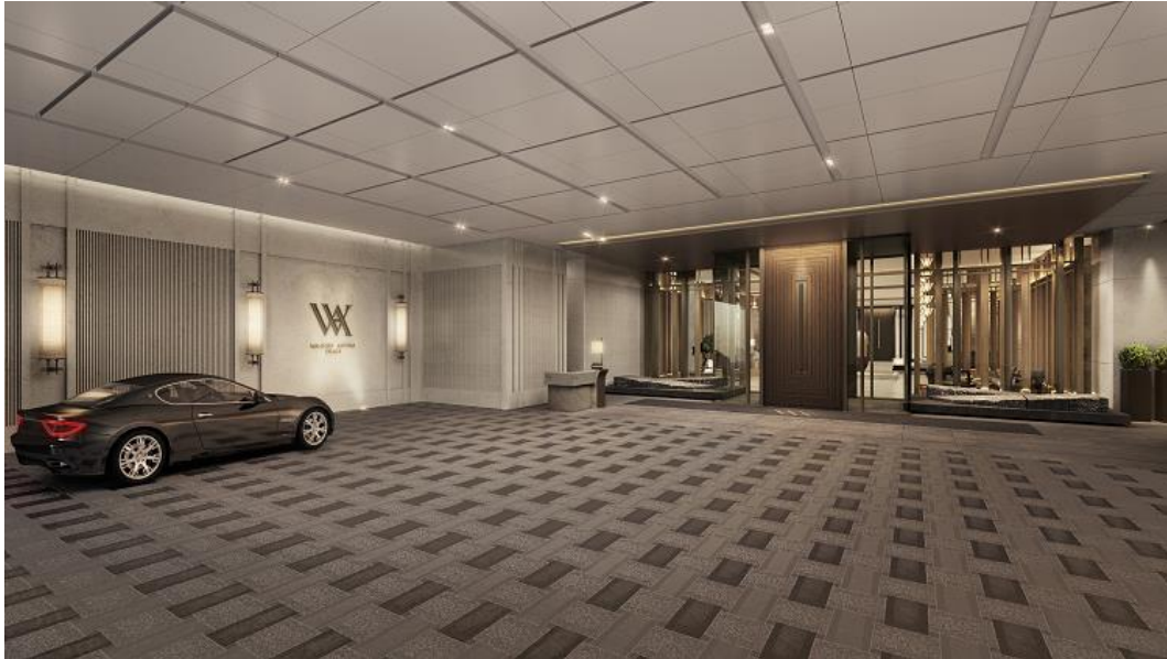
ウォルドーフ・アストリア大阪「1階車寄せ」(完成予想イメージ)

ホスピタリティ業界のグローバルリーダーであるヒルトンの1ブランドとして、世界中のランドマークとなる場所に約35軒のアイコン的なホテルを展開しているウォルドーフ・アストリア・ホテルズ&リゾーツは、お客さま一人ひとりに向けたパーソナルなサービスと食への追求とこだわりをお約束する特別な場所を提供します。インスピレーションを受ける見事なまでの空間と「True Waldorf Service」を体験できるウォルドーフ・アストリア・ホテルは、予約からチェックアウトをするまで極上のサービスをお客さまにお届けします。