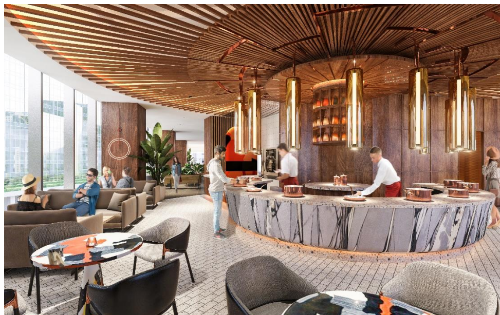
キャノピーby ヒルトン大阪梅田「キャノピー・セントラル」(完成予想イメージ) ※今後変更となる可能性があります

ヒルトンのライフスタイルブランド「キャノピーby ヒルトン」は、リラックスして充電できるネイバーフッドのような場所であり、お客さま志向のシンプルなサービス、快適な空間とその土地ならではのこだわりのものを提供します。ホテルはそのエリアからインスピレーションを受けたデザインや、新しいアプローチでおもてなしとご滞在をお客さまにお届けします。現在、キャノピーby ヒルトンは世界で32軒展開し、15の国・地域で29軒が開業予定です。