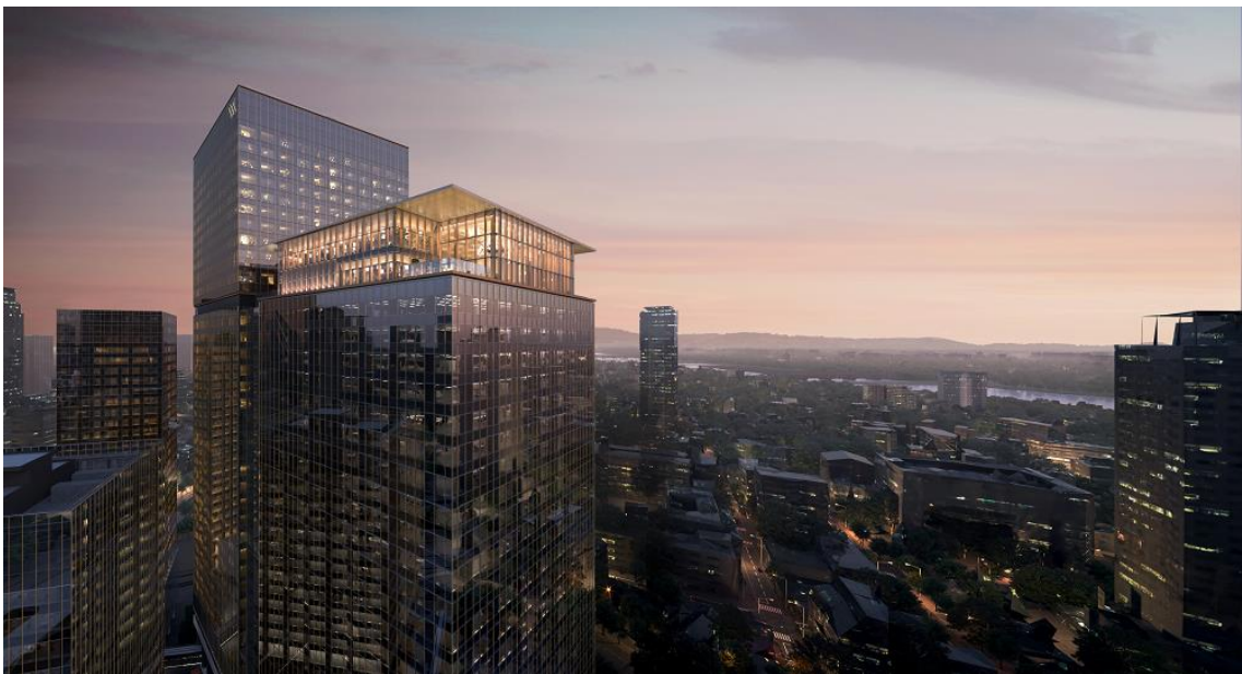
ウォルdorf・アストリア大阪「外観」（完成予想イメージ）

「ウォルdorf・アストリア大阪」は、南街区賃貸棟・西棟の2階および28階～38階に位置します。50平米を中心とする252室の客室のほか、ウォルdorf・アストリアの象徴であるラウンジ&バー「ピーコック・アレー」や、レストラン、フィットネス、スパ、屋内プール、チャペル、ライブラリー・ラウンジ、宴会場、会議室などを設置する予定です。