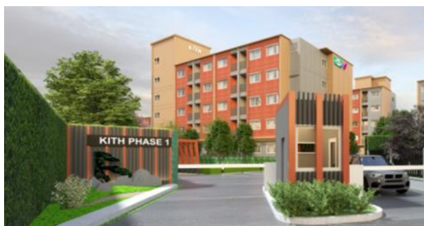
『(仮称)Bangna KM29(バンナーKM29)プロジェクト』

* 『(仮称)Omnoi(オムノイ)プロジェクト』『(仮称)Kallapaphruek(カラパブルック)プロジェクト』は、セナ社のグループ会社であるセナJ社との共同プロジェクト。