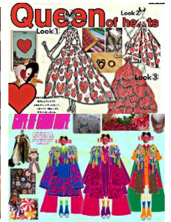
GRAND WISH STUDENT COLLECTION 展示衣装イメージ

※新型コロナウイルス感染拡大の状況等により、本イベント内容は一部変更、または中止となる可能性がございます