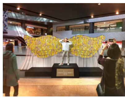
GRAND WISH OBJECT～希望の翼～ オブジェ完成イメージ