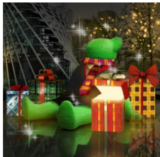
「テッド・イバール」特別装飾 ～魔法ワールドからのギフトボックス～