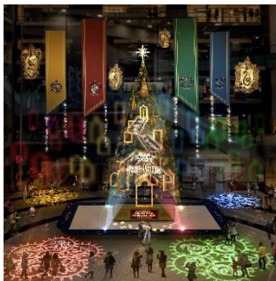
メインクリスマスツリー 『Floating Magic Tree 浮遊する魔法の樹』