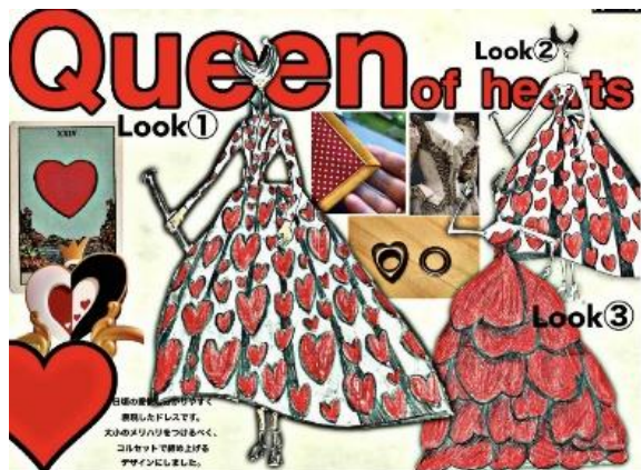
▲展示衣装イメージ