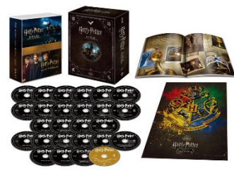
▲プレゼント賞品イメージ

グランフロント大阪館内のクリスマス装飾やフォトスポット、イルミネーション、グルメなどの写真にハッシュタグ「#グランフロントクリスマス」を付けて Instagram に投稿いただいた方の中から、抽選で魔法ワールドグッズをプレゼントする SNS 投稿キャンペーンを実施します。さらに、館内8箇所のスポットをコンプリートしたスタンプラリー台紙の写真を投稿いただいた方はWチャンス企画にも参加いただけます。