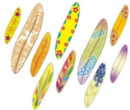
▲メッセージカードイメージ

大阪文化服装学院の学生たちによってデザインされたメッセージカードに、来街者・就業者の皆様から「WISH(希望・願い)」を込めたメッセージを記入いただき、ご自身でオブジェに飾り付けていただく参加型イベントを開催します。まちに訪れる一人ひとりの皆様と共に創り上げる、世界に一つだけのオブジェが期間限定で登場します。