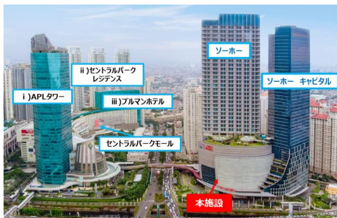
ポドモロシティの外観