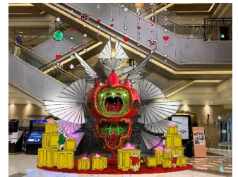
▶ハービスPLAZA 1F オルガン広場

ルーシー博士たちは無事地球へと戻ってきました。この旅がとても過酷で危険だったことを物語るようにスペースシップはダメージを受けています。