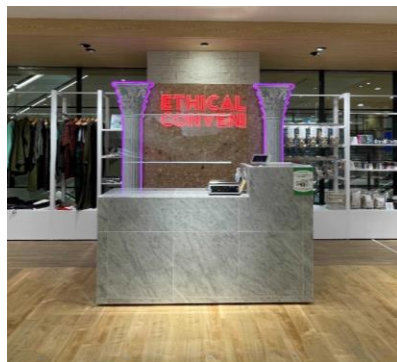
▶エシカルコンビニ