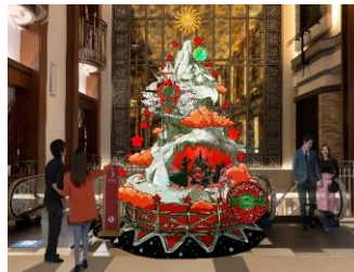
▶ハービスPLAZA ENT 4F

洞窟の中に現れたのは月の石で作られた巨大な都市。そこはキノコから生まれたヒューマノイド（キノコの化け物）部族の街でした。彼らはルーシー博士たちに怒っているように見えます。ルーシー博士たちの運命は。