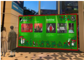
▶ハービスPLAZA ENT B1

ニコラ氏がハービスのクリスマスのために作り上げた物語やドローイング、作品ができるまでのプロセスを紹介