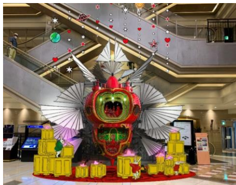
▶「UN VOYAGE DANS LA LUNE ～月への旅行/新しい発見と出会い～」ビジュアル

今年のクリスマスは、昨年に引き続きフランス人アーティスト Nicolas Buffe（ニコラ・ビュフ）氏が館内装飾「UN VOYAGE DANS LA LUNE ～月への旅行/新しい発見と出会い～」を展開。昨年描かれた壮大な物語が、今年のクリスマスに完結を迎えます。また、モデルの富永愛さんによるハービス各店舗のエシカルな商品・取組みの紹介や、富永さん自身のエシカルなライフスタイルに関するインタビューも公開。地球と私にいいことをコンセプトにした「エシカルコンビニ」が期間限定でハービスPLAZA ENT3Fにオープンします。