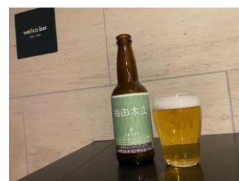
[出来上がったビールで乾杯!]

CRUST JAPAN は生産工程で生じる食品ロスを「美味しくアップサイクル」することをモットーに設立されたシンガポール発のフードテックです。同社は、阪急阪神不動産が運営するスタートアップ向け会員制シェアオフィス「GVH#5」に入居しており、今回、阪急阪神不動産と連携して、ビールのレシピ開発に携わることになりました。