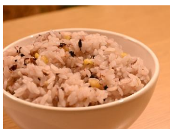
[ランチで消費できなかった雑穀米]