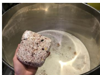
[ビールの副原料に]