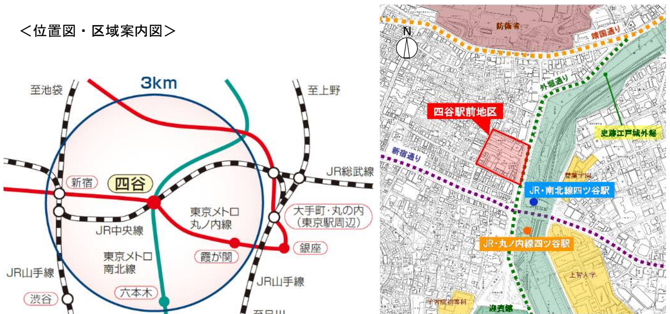
この地図は、東京都知事の承認を受けて、東京都縮尺 2,500 分の 1 の地形図を複製したものです。無断複製を禁じます。(承認番号)22 都市基交第 275 号