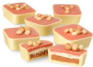
ストロベリーチーズケーキ(6個入) 850円(税込)