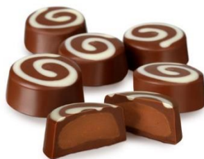
プラネチョコレート (6個入) 850円(税込)