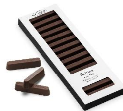
チョコレートバトン(15本入) 1,000円(税込)