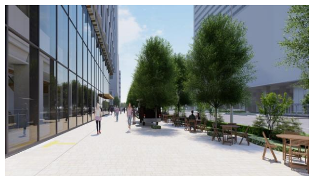
道路上での食事施設・休憩施設の設置イメージ