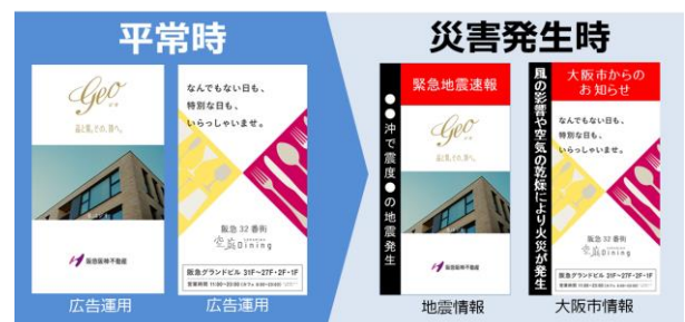
デジタルサイネージは災害時に広告から災害情報に自動切替