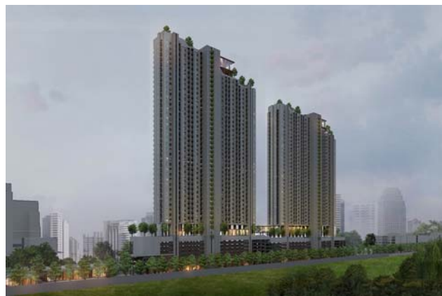
※『PITI Bangchak(ピティ バンチャック)』、『Niche Mono Ramkhamhaeng(ニッチ モノ ラムカムヘン)』のイメージパース