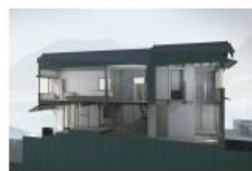
京谷友也 《伊根の舟家》