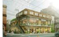
三井嶺 《柳小路南角》