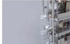
中川エリカ 《塔とオノマトペ》