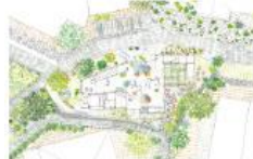
富永美保 《真鶴出版 2 号店》