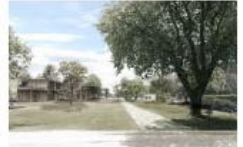
服部大祐+ スティーブン・シェンク 《Territory of Perception》