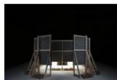
高杉真由+ ヨハネス・ペリー 《NOSE》