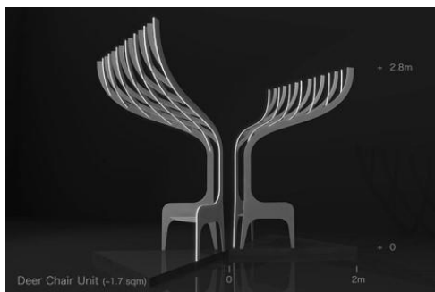
グランプリ「Deer Forest II」