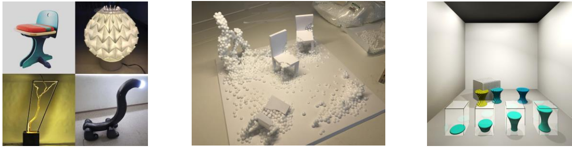
▲展示作品イメージ