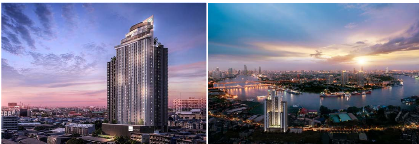
※『Niche Mono Charoen Nakorn(ニッチ モノ チャルーン ナコーン)』のイメージパース