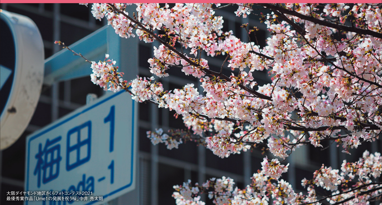
大阪ダイヤモンド地区さくらフォトコンテスト2021 最優秀賞作品「Ume1の発展を祝う桜」中井 亮太郎