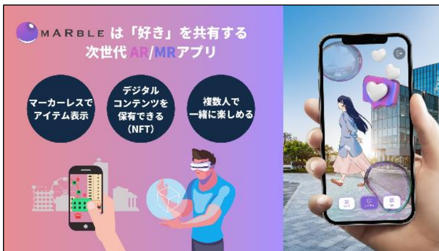
MarbleXR(株) サービス概要イメージ

最優秀賞を受賞した「MarbleXR株式会社」は、ピッチテーマの一つである「安全でクリエイティブな都市生活、スマートでウェルネスなまちづくりの実現」に、寄与する可能性が高く評価されました。