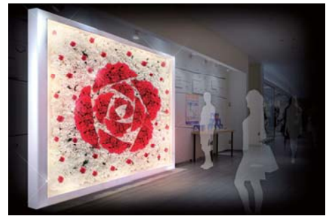
上記あくまでもイメージとなります。