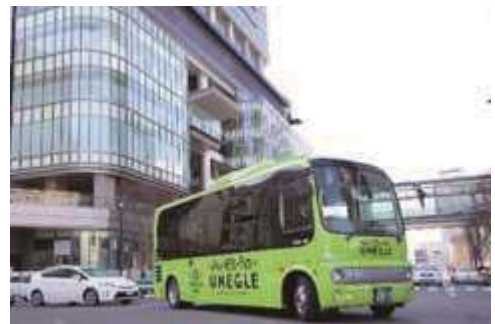
写真は通常のバスです