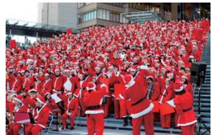
※参考 PEOPLE'S TREE (2013～2016年)