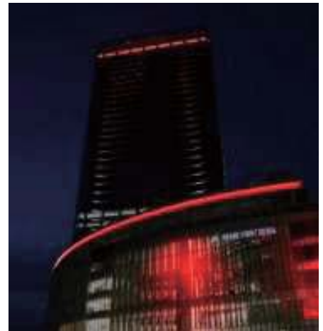
実施イメージ(実施場所は変更となる場合がございます)