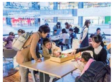
上記あくまでもイメージとなります。