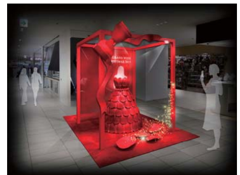
上記あくまでもイメージとなります。