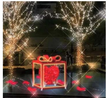
上記あくまでもイメージとなります。