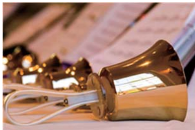
上記あくまでもイメージとなります。