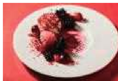
上記あくまでもイメージとなります。