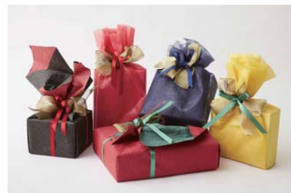
上記あくまでもイメージとなります。