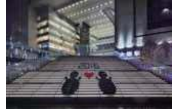
上記あくまでもイメージとなります。