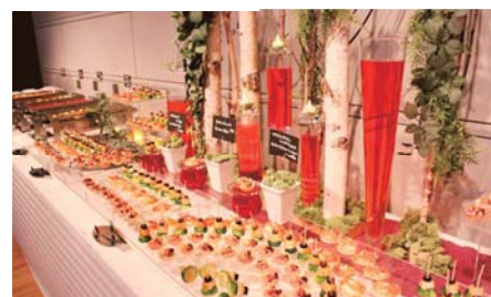
上記あくまでもイメージとなります。