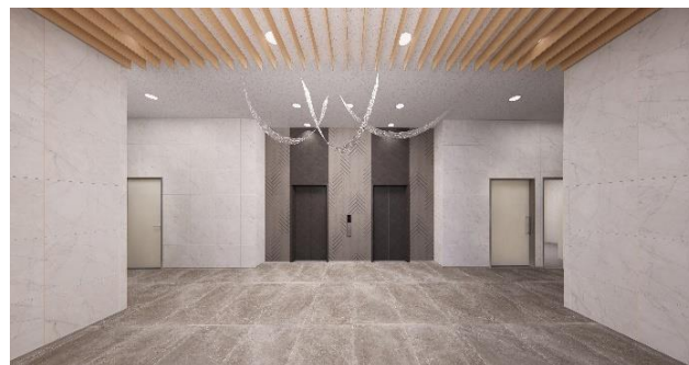
「ロジスタ北伊丹」(エントランスイメージ)