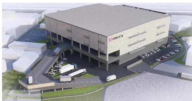
「ロジスタ北伊丹」(外観イメージ)