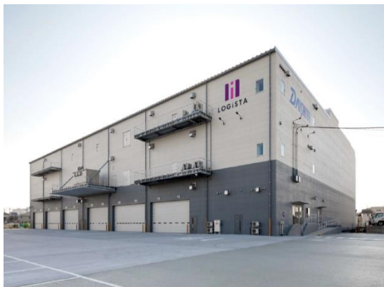
「ロジスタ大阪松原」

※快適な室内環境を保ちながら高効率設備等により省エネルギーに努めることで、同規模の標準的な設備仕様の建築物と比較し、一次エネルギーの年間消費量が大幅に削減されている建築物。削減量に応じて、『ZEB』、Nearly ZEB、ZEB Ready、ZEB Oriented の4つに定義される。ZEB Ready は、50%以上の一次エネルギー消費量を削減した建築物。