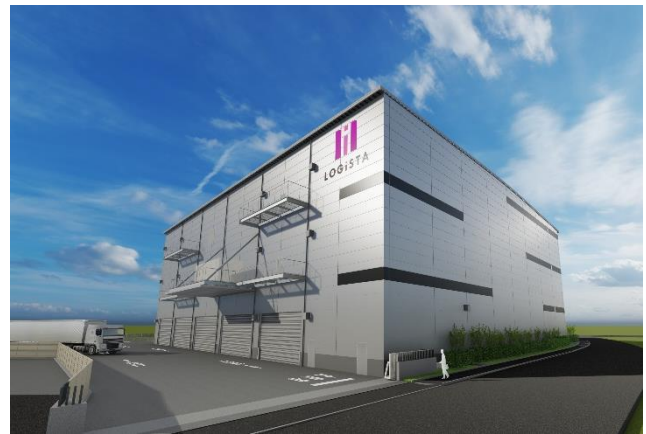
建物外観イメージ

「ロジスタ大阪松原」は、地上3階建て・延床面積約14,000㎡で、阪神高速「三宅IC」まで約3.5km、阪和自動車道「松原IC」まで約4.4kmの地点に、「ロジスタ豊中」は、地上3階建て・延床面積約8,300㎡で、阪神高速「豊中南IC」まで約3.5km、名神高速「豊中IC」まで約4kmの地点に立地しております。両施設とも複数の高速道路へのアクセスが良好で、関西圏の消費地を広くカバーすることが可能であるとともに、大阪中心部にも近く都市部近郊への配送拠点に適しております。