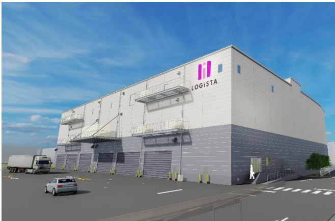
建物外観イメージ