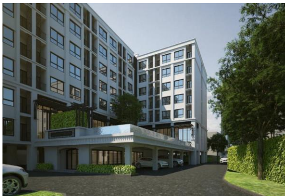
※『(仮称)Bang Pho(バン ポー)プロジェクト』、『(仮称)Itsaraphap(イツサラパーブ)プロジェクト』のイメージパース