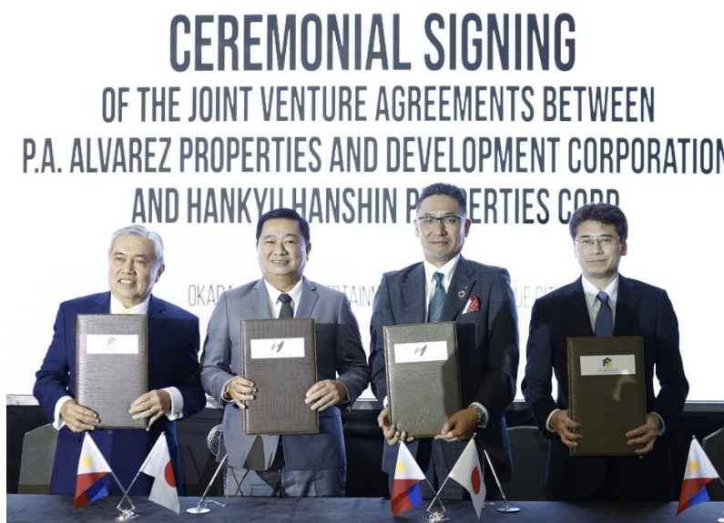
共同事業契約締結セレモニーの写真