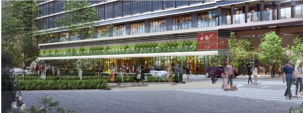
2階東側外壁の壁面緑化

【添付資料】 別紙 「阪急西宮ガーデンズ プラス館」のテナント一覧 ご参考 阪急阪神不動産の運営施設のご紹介