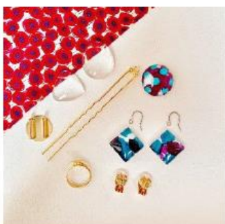
ガラスカボションアクセサリー