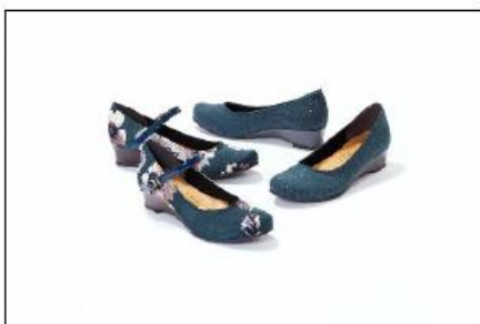
▲南館1F「マーレマーレ パンプショップ ジャパンクラフト」 三番街限定オリジナルパンプス 各6,160円