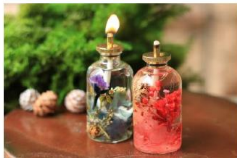
ハーバリウムランプ