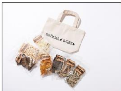
▲南館B1F「ピーツー ドッグ&キャット」 限定ハッピーバッグ 3,300円