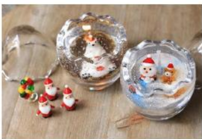
ジェルキャンドル