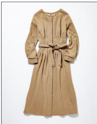
▲南館B1F「ケティシェリー」 三番街別注ワンピース 16,500円