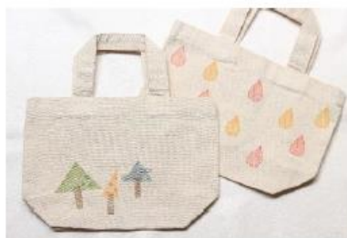
オリジナルトートバッグ