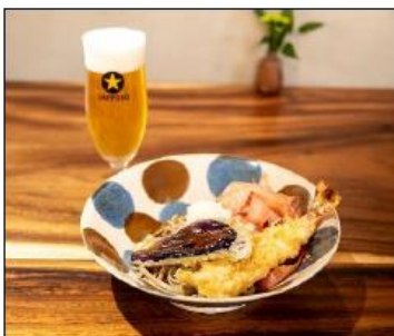
▲南館B2F「しのぶ庵」 50年前の復刻版メニュー 辛味大根海老天おろし 1,430円