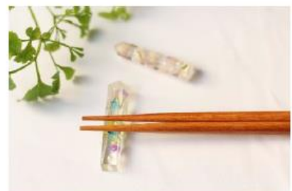
ドライフラワーの箸置き