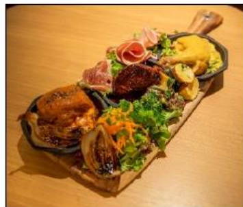
▲北館B2F「ラグー」 ラグーの煮込み3種盛り合わせ 3,500円