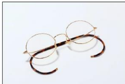
▲南館1F「マズナガ1905」 三番街限定18Kフレームセット 500,000円