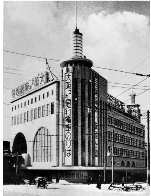
旧神戸阪急ビル東館の外観

高層部では、低層部の色彩等を踏まえつつ、彫の深いデザインとすること等により、シンボリックな外観を形成しました。