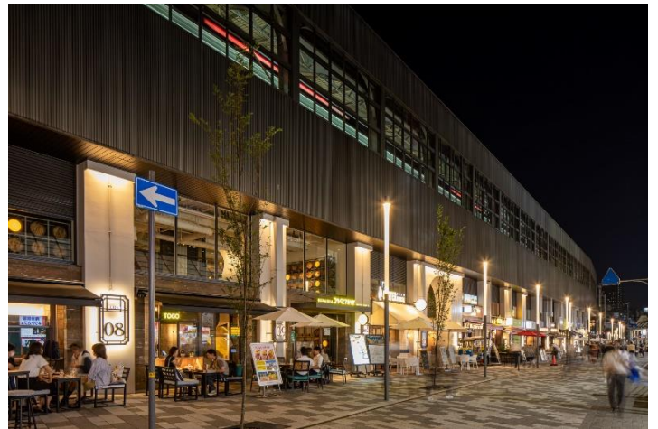
ビル北側の石畳街路とオープンテラス

本ビルでは、駅の構外コンコースと駅前の公共広場を連続性のあるデザインとすることで、駅と街との一体感を演出しました。また、本ビルの北側においては、神戸市がビル沿いの歩道部分を石畳街路に拡幅整備するとともに、同街路に、同市のご理解・ご協力も得て飲食店のオープンテラスが設けられるようにし、それにより街の賑わいを創出しました。