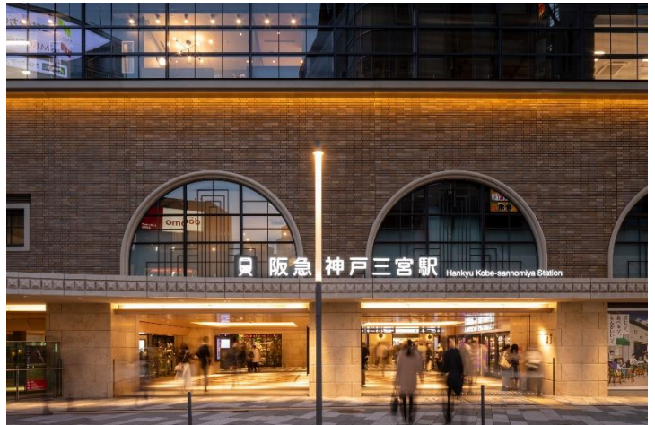
本ビル北側の公共広場へつながる駅コンコース（東側）出入口