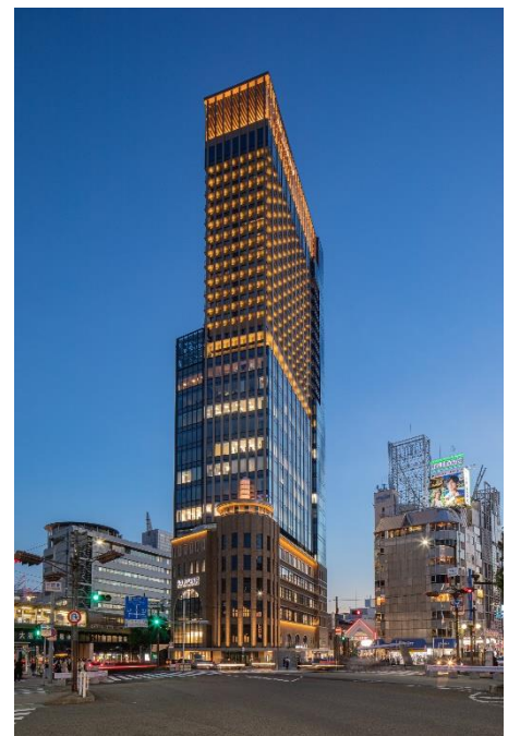
ライトアップされた本ビルの外観（北東側より臨む）