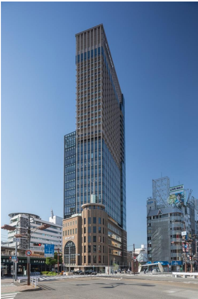
本ビルの外観（北東側より臨む）