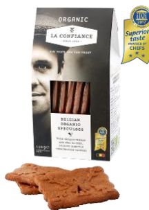
オーガニックスペキュロス