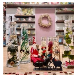
ワークショップ イメージ

※期間内のレシート合算可。実施場所にてレシートをご提示ください。「SOCIO(ソシオ)」によるクリスマスにちなんだワークショップは無料。