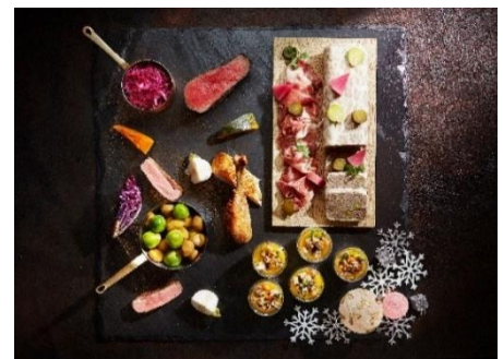
クリスマスbuffet イメージ (NOKA Roast & Grill)