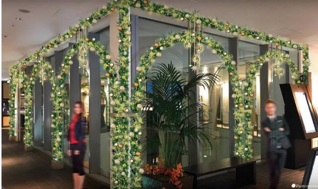
南館8階 エスカレーター横・吹き抜けエリア 実施イメージ