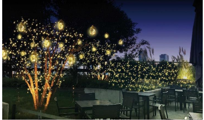
南館9階 屋外植栽エリア 実施イメージ