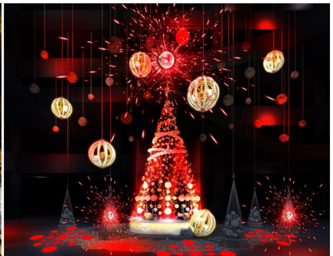
『Brilliant Tree』(ライティングショー時)

グランフロント大阪（大阪市北区大深町）は、訪れる人々の心を、そして大阪を光り輝かせるクリスマス『GRAND WISH CHRISTMAS 2019』を11月7日(木)から12月25日(水)まで開催します。