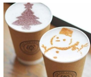
スノーマンフード イメージ (北館1階 OVER THE CENTURY)