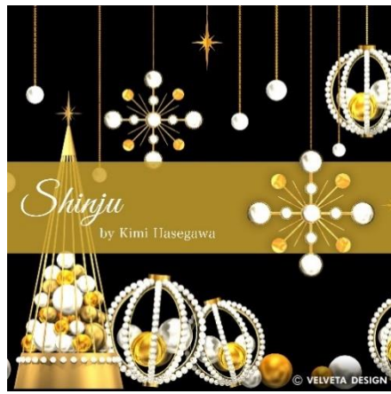
『Kimi Collection “Shinju-真珠”』

<実施期間> 2019年11月7日(木)～12月25日(水) ※ライティングショー:17:00～24:00