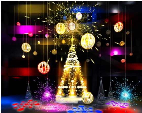
『Brilliant Tree』(ライティングショー時)

※ 2019年冬デビューのコラボレーションライン最初のコレクション。パールやジュエリーにインスパイアされた、ゴールドを基調とした華やかなデザインが特徴。