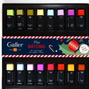
ガレーチョコレート