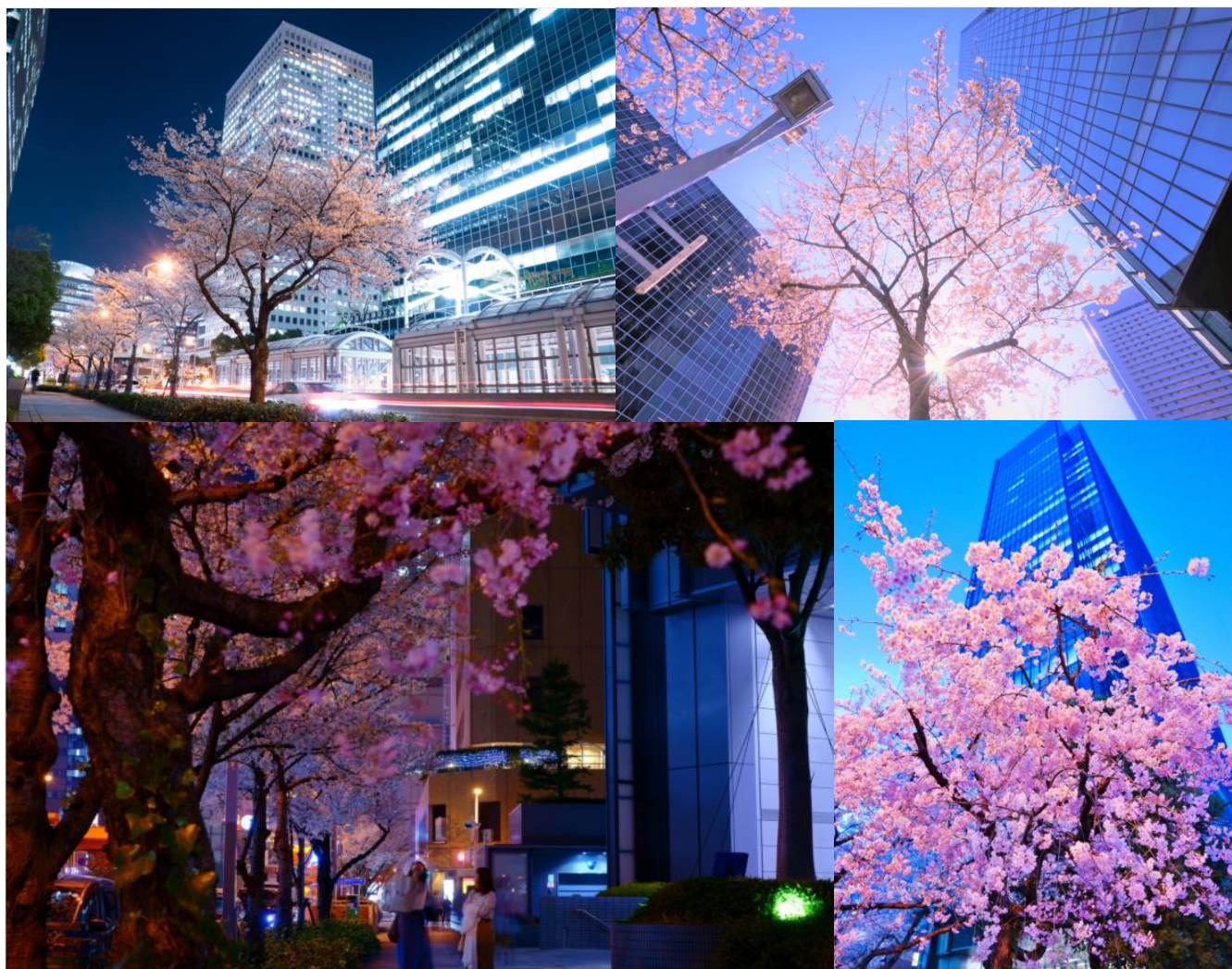
<昨年の優秀賞作品の一部>

今回開催する「大阪ダイヤモンド地区 さくらフォトコンテスト2019」の概要は、別紙のとおりです。