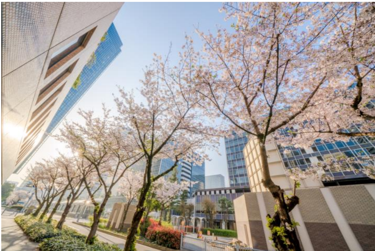
<昨年の最優秀賞作品>

今回で3回目を迎えるこのコンテストは、美しい桜があふれる大阪ダイヤモンド地区の高層ビル群と自然の美しい調和を写真に収めていただくというもので、地下街が発達している梅田地区にあって、日ごろ地下を歩いている方にも、『都会の真ん中に咲いている桜』だからこそその魅力を感じて地上を歩いていただき、改めて、同地区の魅力を多くの方々に発見してもらおうというものです。昨年からはInstagramでの応募も開始し、徐々に地区イベントとして定着しつつあります。