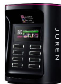
レンタルスタンド（イメージ）

「充レン」は、レンタルスタンドでモバイルバッテリーをレンタルすることができる東京電力エナジーパートナー株式会社が展開しているサービスです。ビジネスやお出かけの際はもちろんのこと、万一の災害時にも、スマートフォンを充電することができます。また、ご利用後のモバイルバッテリーは、いずれのレンタルスタンドでも返却することが可能です。