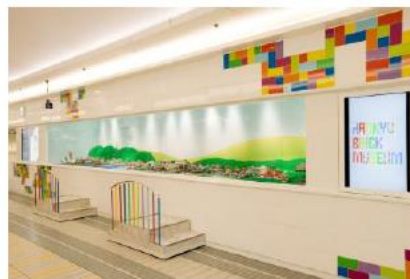
阪急三番街 北館1階 「HANKYU BRICK MUSEUM」