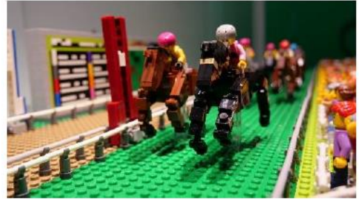
「阪神競馬場（1着を争う競走馬たち）」