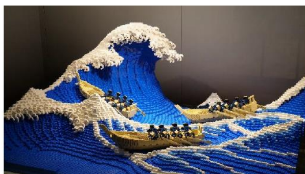
「神奈川沖浪裏」全景

阪急大阪梅田駅に併設した商業施設「阪急三番街」（運営：阪急阪神ビルマネジメント株式会社）では、北館1階に設置している「 はんきゅう ブリック ミュージアム HANKYU BRICK MUSEUM」において現在展示中のレゴ®ブロック全5作品のうち、新たに3作品が12月11日（金）12時に登場します。