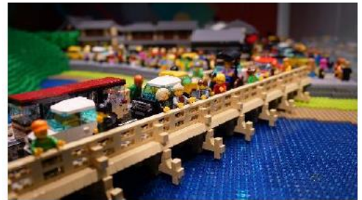
「嵐山（賑わう渡月橋）」