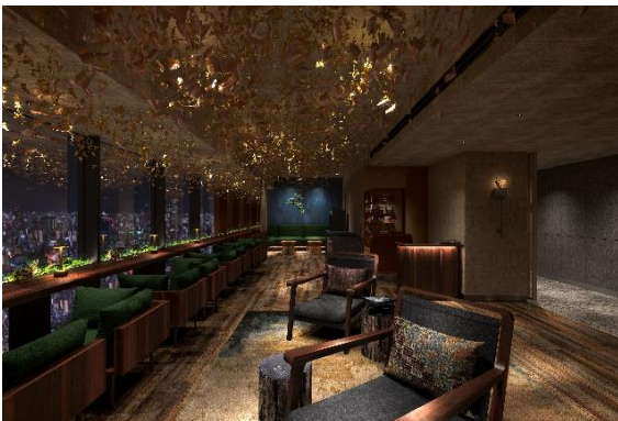
▲クラブラウンジ（完成予想イメージ）

6階には、ご宿泊のお客さまがご利用いただける宿泊者専用ラウンジを設置します。旅慣れたお客さまがご自分のスタイルに合わせてフレキシブルにご利用いただける施設で、着替えができる小部屋やパウダールームも併設します。