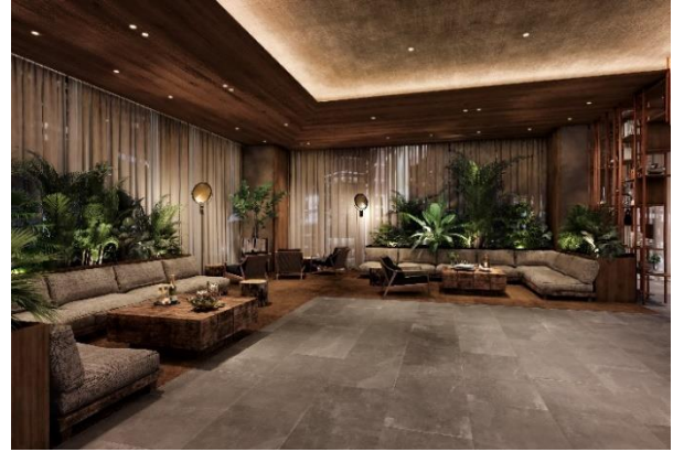
▲ホテルロビー（完成予想イメージ）