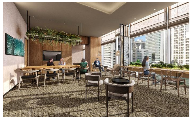
▲宿泊者専用ラウンジ（完成予想イメージ）