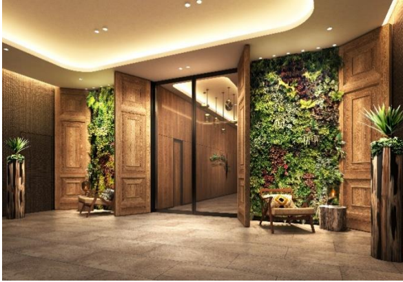
▲エントランス（完成予想イメージ）

大阪（梅田）を拠点にした、観光・レジャー目的の旅慣れた大人のインバウンドツーリストをメインターゲットにしており、ここにしかない新たな価値を創出することで、お客さまを、都会の喧騒を忘れることができる別世界へと誘います。