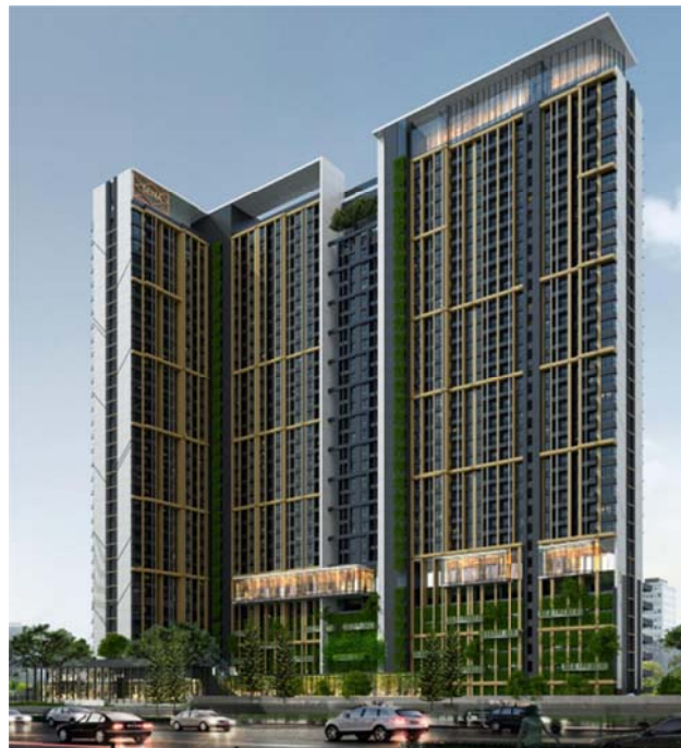
※『ニッチ モノ スクンビット70』のイメージパース