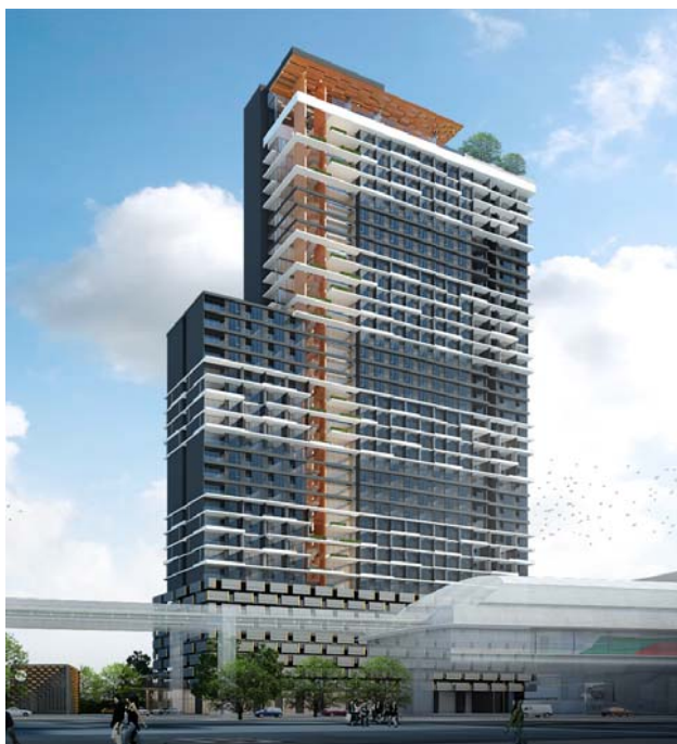
※『ニッチ プライド タオープン インターチェンジ』のイメージパース